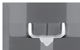
Нормальное состояние электродов

• Для свечей зажигания с предварительной камерой, на начальном этапе утечки газа свечи зажигания, за исключением наличия эрозии стальной трубки, это не повлияет на ее производительность зажигания. Поэтому ее трудно обнаружить; Но как только внутренняя утечка достигает определенного уровня (имеется определенное продольное смещение в керамической части изделия), при вибрации агрегата электрод зажигания также будет испытывать боковое смещение, вызывая изменения размера зазора между электродами; Это изменение напрямую приводит к увеличению частоты пропусков зажигания, в конечном итоге проявляющееся в снижении температуры цилиндра на агрегате.