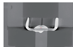
Продольное смещение и изменение зазора электродов